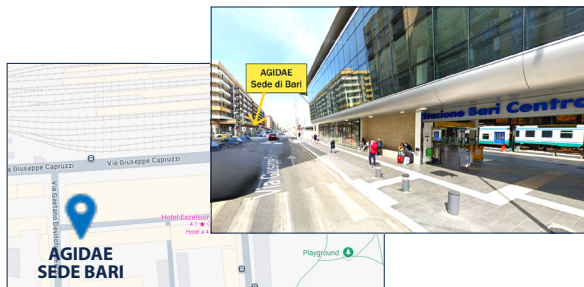
La sede AGIDAE di Bari a 200 metri dalla Stazione Centrale